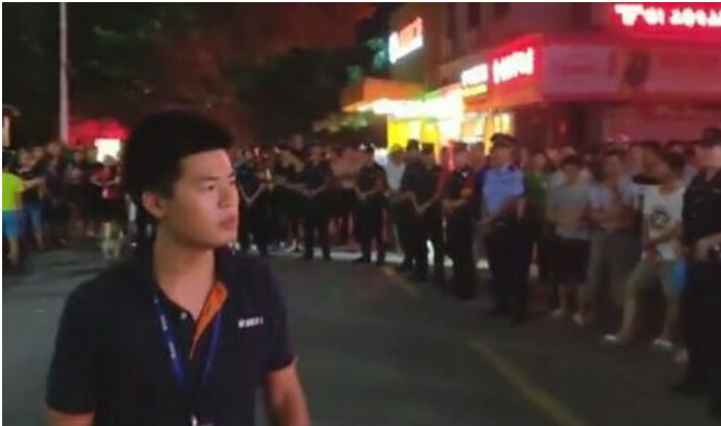
Illustration 10: Ein Jiasic-Arbeiter spricht auf einer Kundgebung

Shen Mengyu geht gemeinsam mit anderen Unterstützern zur Yanziling Polizeiwache, aber etwa 200 Meter vor der Wache werden sie von Polizisten aufgehalten und umringt. Während sie Forderungen rufen und singen, wird ein Unterstützer von einer unbekannten Person angegriffen. Die Polizisten nehmen den Angreifer zunächst mit auf die Wache, später stellt sich heraus, dass der Unbekannte denselben Namen hat wie der Leiter des örtlichen Ordnungsamtes.