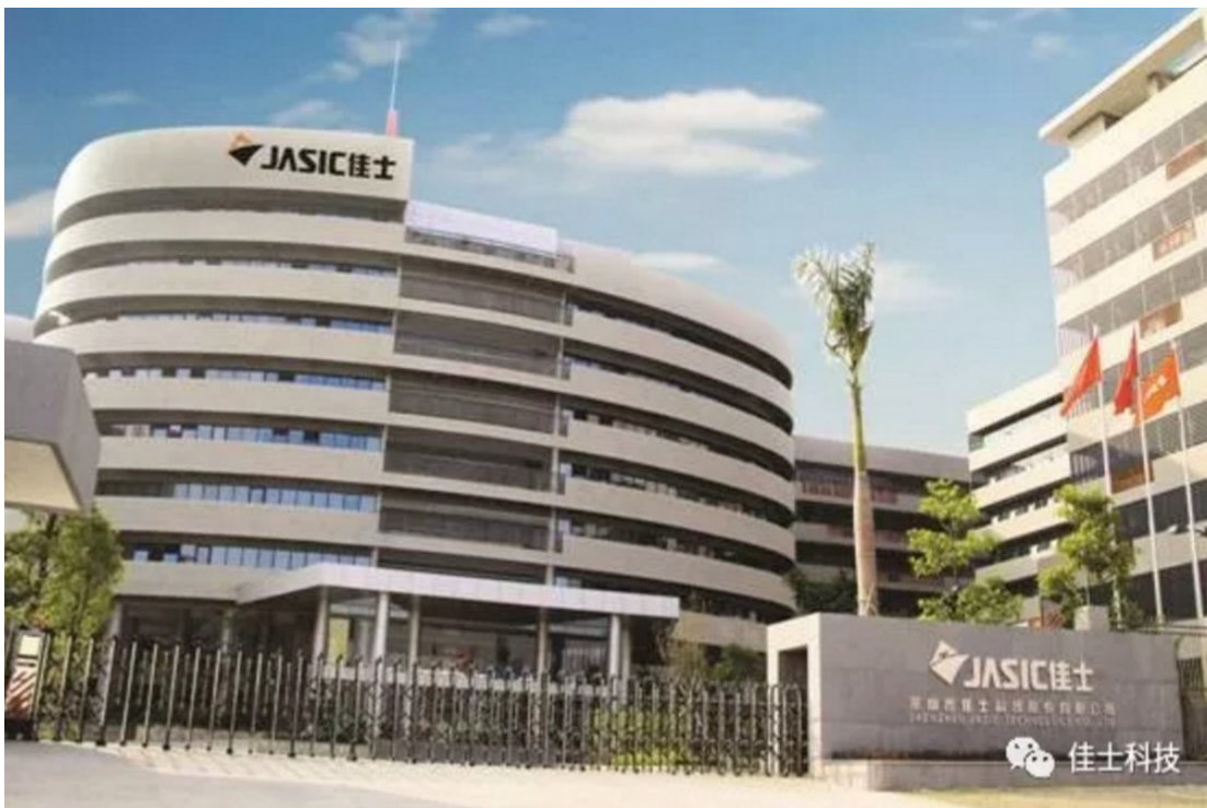
Illustration 1: Sitz der Jiasic Technology