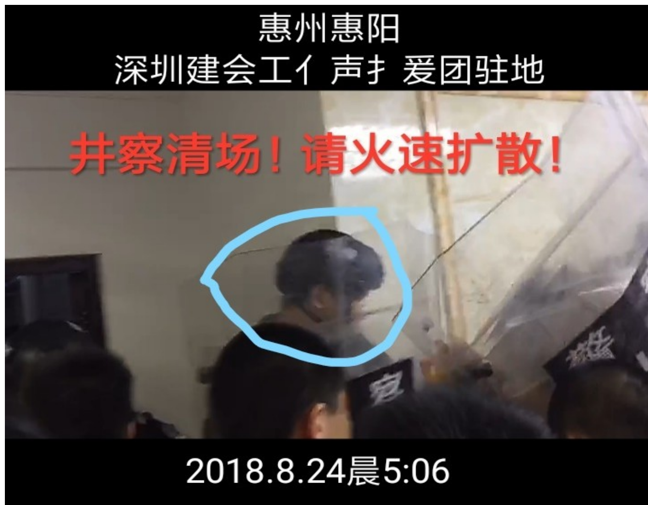
Illustration 19: Sondereinheiten der Polizei zur Aufstandsbekämpfung stürmen die Wohnung der Solidaritätsgruppe

Abends um 23:33 veröffentlicht die staatliche Xinhua Nachrichtenagentur die offizielle Geschichtsfälschung der Ereignisse. Unter dem Titel "Hintergründe der Rechtsstreitigkeiten Shenzhener Jaisic-Arbeiter" werden alle illegalen Machenschaften der Jiasic Technology verleugnet, alle mündlichen Unterstützungsversprechungen der Gewerkschaft geleugnet und wird eine fantastische Verschwörungstheorie gestrickt, die die Arbeiter und Unterstützerinnen als von einer "ausländischen", gemeint ist hier eine Hong Konger NGO manipuliert darstellt.