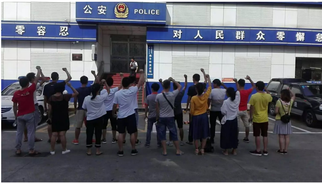
Illustration 5: Am 20. Juli vor der Polizeiwache