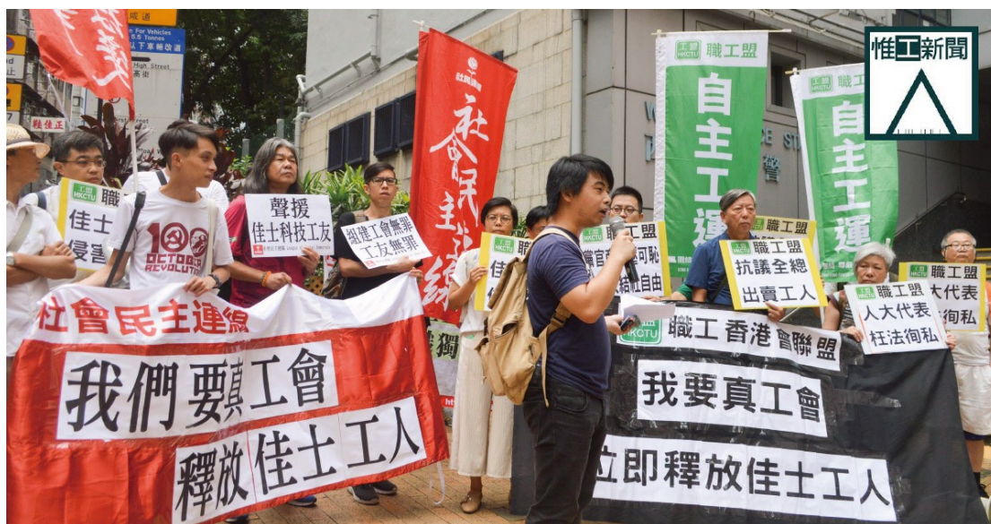
Illustration 13: Proteste in Hong Kong rufen zur Unterstützung der Jiasic-Arbeiterinnen auf und fordern "echte Gewerkschaften"

Am Morgen organisiert der Hong Konger Gewerkschaftsverband eine Protestkundgebung vor der chinesischen Vertretung in Hong Kong.