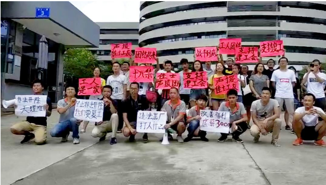
Illustration 7: Arbeiterinnen fordern die Abschaffung der “18 Verbote”, 3000 Yuan Lohn, das Ende der illegalen Machenschaften...