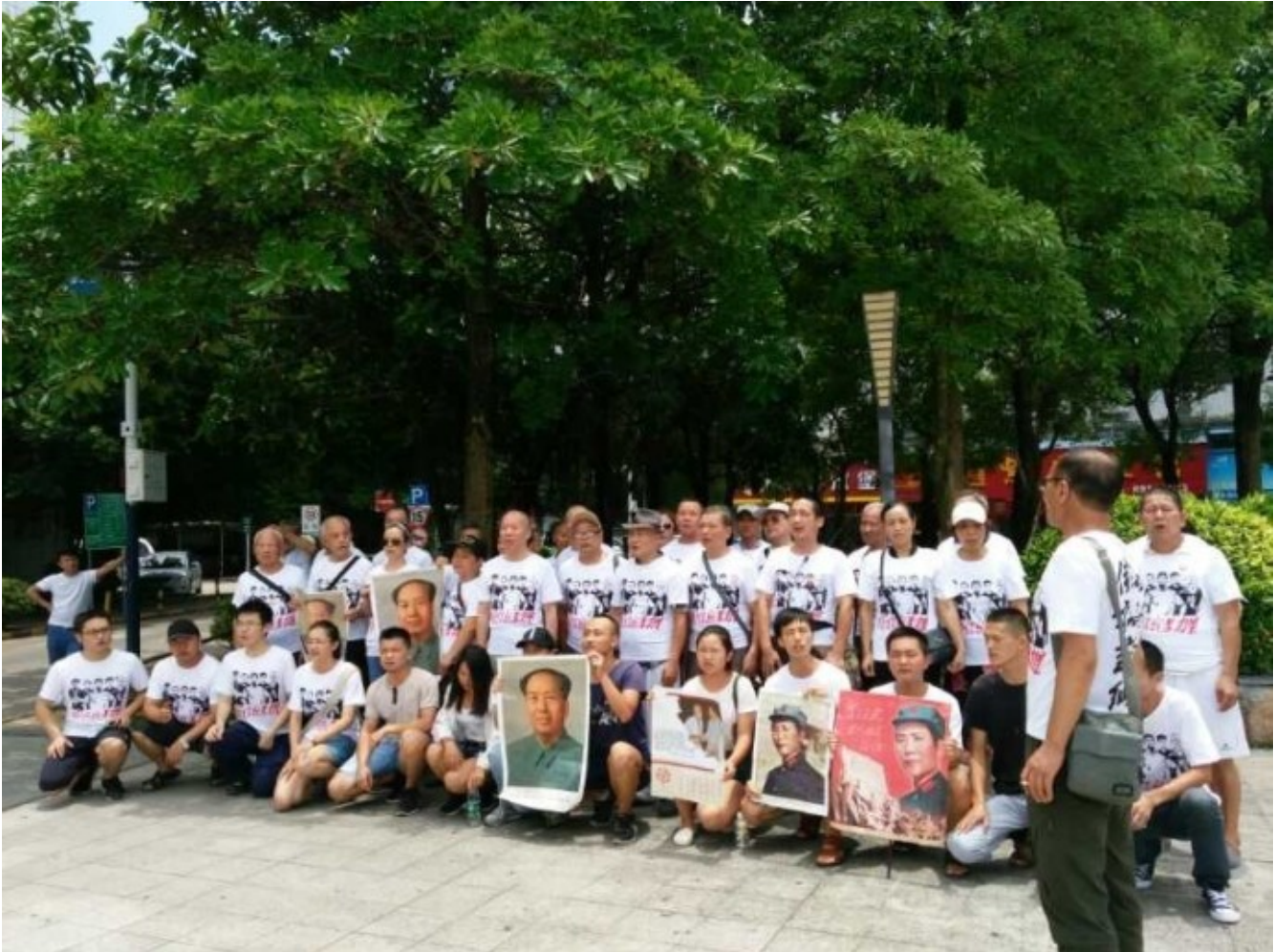
Illustration 16: Eine der vielen Solidaritätskundgebungen

Die Solidaritätsgruppe veröffentlicht einen Brief von Lan Zhiwei anlässlich der andauernden Inhaftierung ihrer Freundin und Kollegin Aying, deren fünf Monate alter Säugling noch in der Stillzeit ist. Hier in Auszügen: