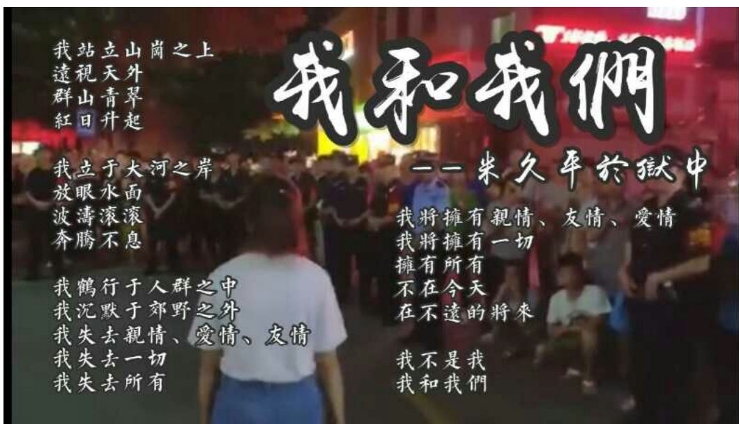
Illustration 14: Dieses Bild mit dem Gedicht "Ich und Wir" wird unzählige Male online verbreitet.