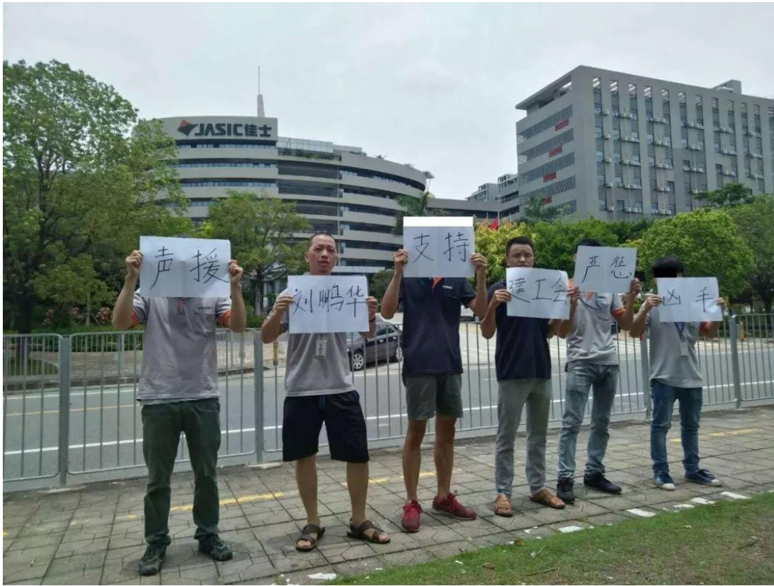
Illustration 4: Proteste von Arbeitern vor der Jaisic Technology

Gegen 7:40 Uhr versuchen die entlassenen Arbeiter wie üblich wieder auf Arbeit zu gehen, aber als sie das Werksgelände betreten wollen, werden sie erst von Wachleuten wieder vom Gelände geworfen und gegen 10:30 Uhr von der Polizei angegriffen und dann abgeführt. Mittags gehen etwa 20 Arbeiterinnen und Unterstützer zur Polizeiwache und protestieren. Um 16:30 kommt eine vollbewaffnete Polizeitruppe, kesselt die Protestierenden ein und nimmt auch sie in Gewahrsam. Nicht wenige wurden dabei verletzt.