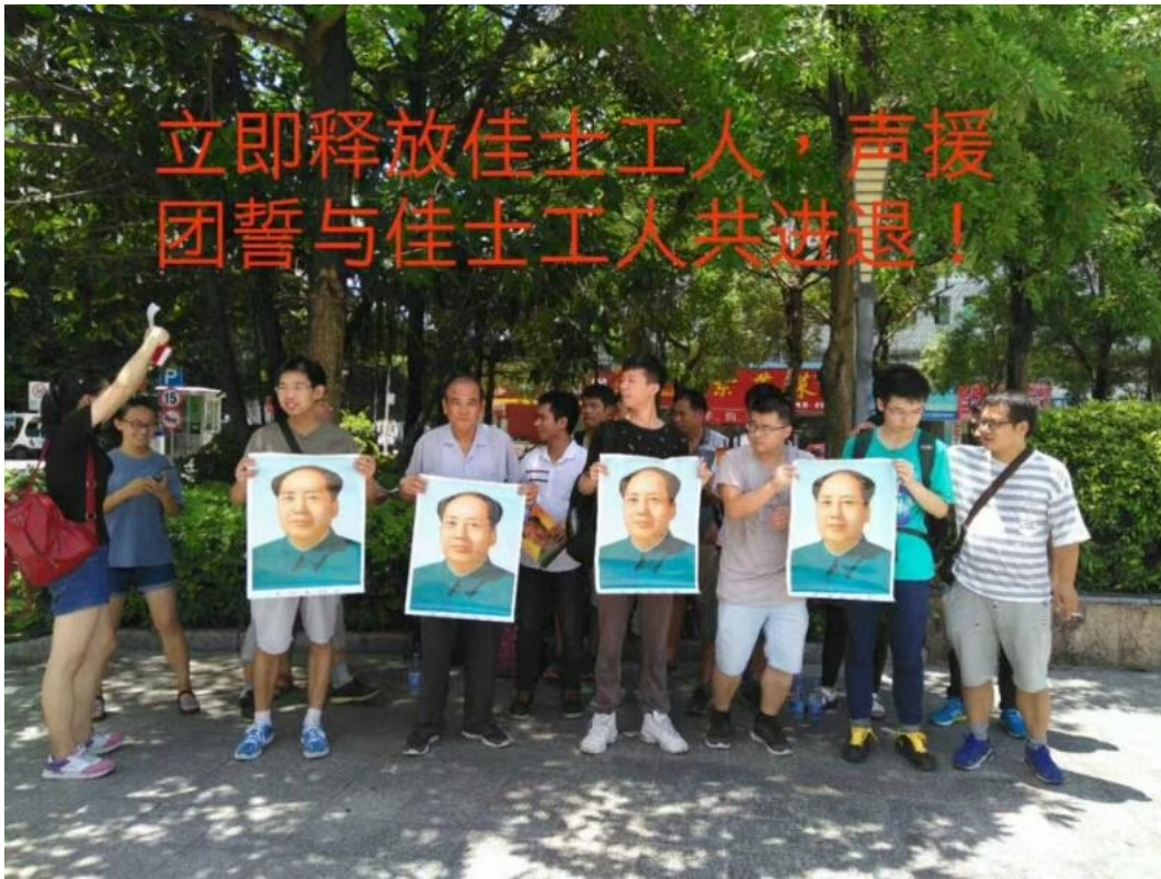
Illustration 11: Proteste am 27. Juli in der Nähe der Yanziling Polizeiwache.

Später teilt die Polizei mit, dass gegen die am 27. Festgenommenen inzwischen wegen Verdacht auf Anstiftung zur Ordnungstörung strafrechtlich ermittelt werde.