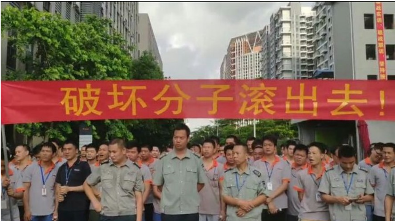
Illustration 8: Die “Arbeiterdemonstration”

Morgens um 7:20 kommen die entlassenen Arbeiterinnen wieder zum Werkstor und verlangen, an ihren Arbeitsplatz gelassen zu werden. Aber diesmal werden sie nicht nur vom Wachschutz aufgehalten, die