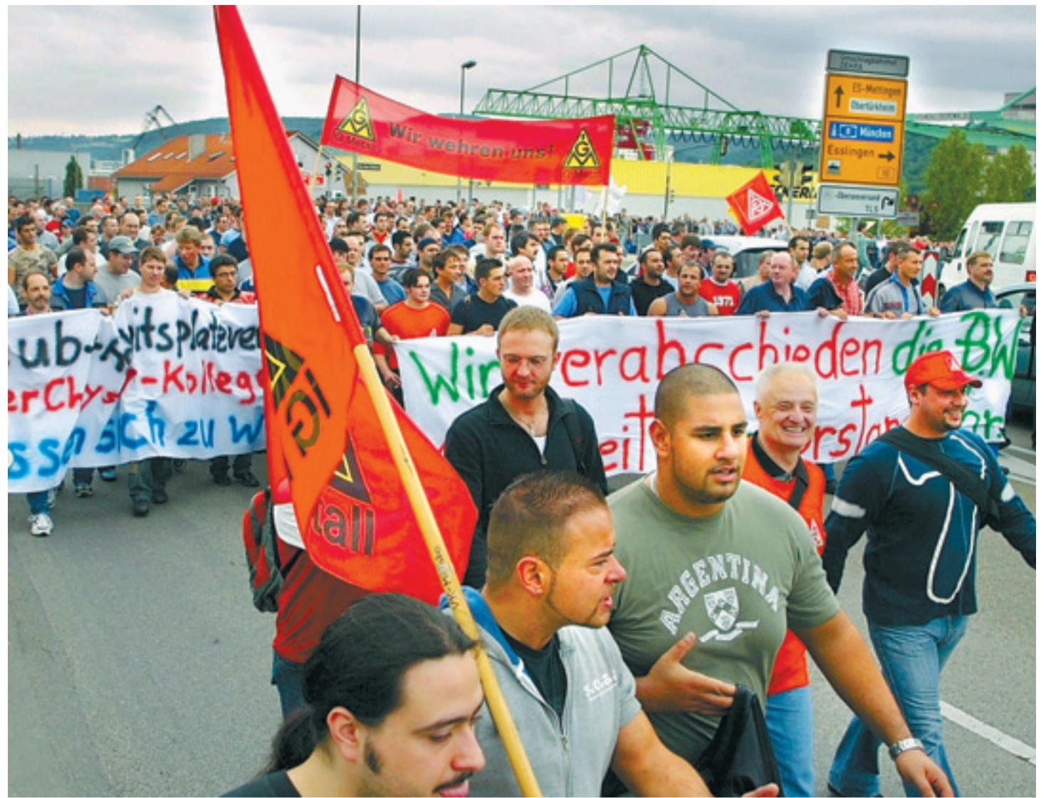
Nicht beim Ordnungsamt angemeldet: Der Marsch der 2000 Mettinger Daimler-Werker auf der B 10 im Jahr 2004.

Die Vorwürfe im Groben, selten feinsinnig formuliert, liegen jedem Streit zugrunde: Die Funktionäre sind zu nahe an der Geschäftsleitung, an der SPD, zu viel Krawatte, zu wenig Blaumann, zu viel Kompromisse, zu wenig Kampf, zu viel Diktatur, zu wenig Demokratie im Innern. Der Paukboden für diesen seit 1996 dauernden Streit ist die