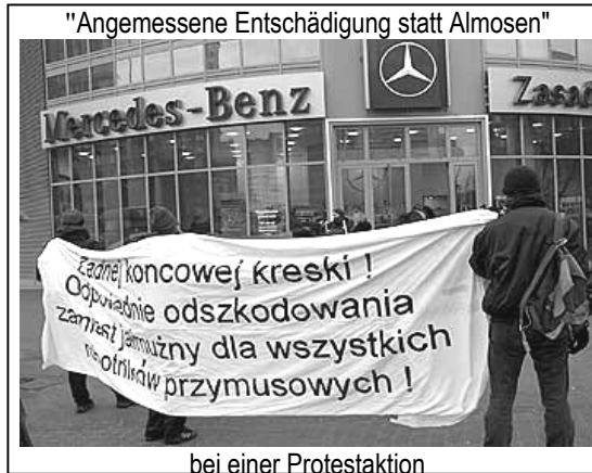
bei einer Protestaktion

„Als die Nazis die Kommunisten holten, habe ich geschwiegen; ich war ja kein Kommunist. Als sie die Sozialdemokraten einsperrten, habe ich geschwiegen; ich war ja kein Sozialdemokrat. Als sie die Gewerkschafter holten, habe ich geschwiegen, ich war ja kein Gewerkschafter. Als sie die Juden holten, habe ich geschwiegen; ich war ja kein Jude. Als sie mich holten, gab es keinen mehr, der protestieren konnte.“ Martin Niemöller (Pfarrer)