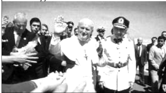
Karel Wojtyla 1987 in Chile mit Diktator Pinochet

Habt ihr mal erlebt, dass der Papst uns seine Unterstützung gab, als wir in die Arbeitskämpfe zogen? Also, wir wissen von keiner Solidaritätserklärung.