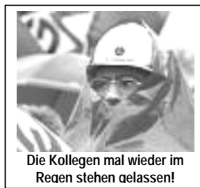
Die Kollegen mal wieder im Regen stehen gelassen!

Uns ist aber nicht nach Feiern zu Mute! Angesichts der immensen Gewinne ist dieser Abschluss ein Schlag ins Gesicht jedes Arbeiters aus der Metall- und Elektroindustrie! Wir mussten in den letzten Jahren hohe Reallohnverluste hinnehmen, trotz ständig wachsender Gewinne. Wovon sollen wir steigende Mieten und die explodierenden Energiekosten bezahlen? Die Gewerkschaftsführung hat uns, klar gesagt, nach Strich und Faden verarscht. Obwohl schon überall, von vielen Kollegen begrüßt, der Arbeitskampf vorbereitet wurde, wurde dann am Wochenende dieser miese Abschluss zusammen gemauschelt. Kurz vorher klang es sogar aus den Kreisen der