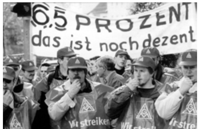
Foto aus der Tarifrunde 2002

Die Tarifrunde bietet die Chance, gemeinsam gegen die Willkür der Konzerne vorzugehen. Sie fürchten einen Streik: Volle Auftragsbücher bringen fette Profite für die Unternehmer und Aktionäre. Doch den Beschäftigten, die für diese Gewinne schufteten, bieten sie gerade einmal 2,5% plus Einmalzahlungen an! Die IG Metall muss die volle Kampfkraft der Beschäftigten nutzen, um diese Dreistigkeiten zurück zu schlagen: